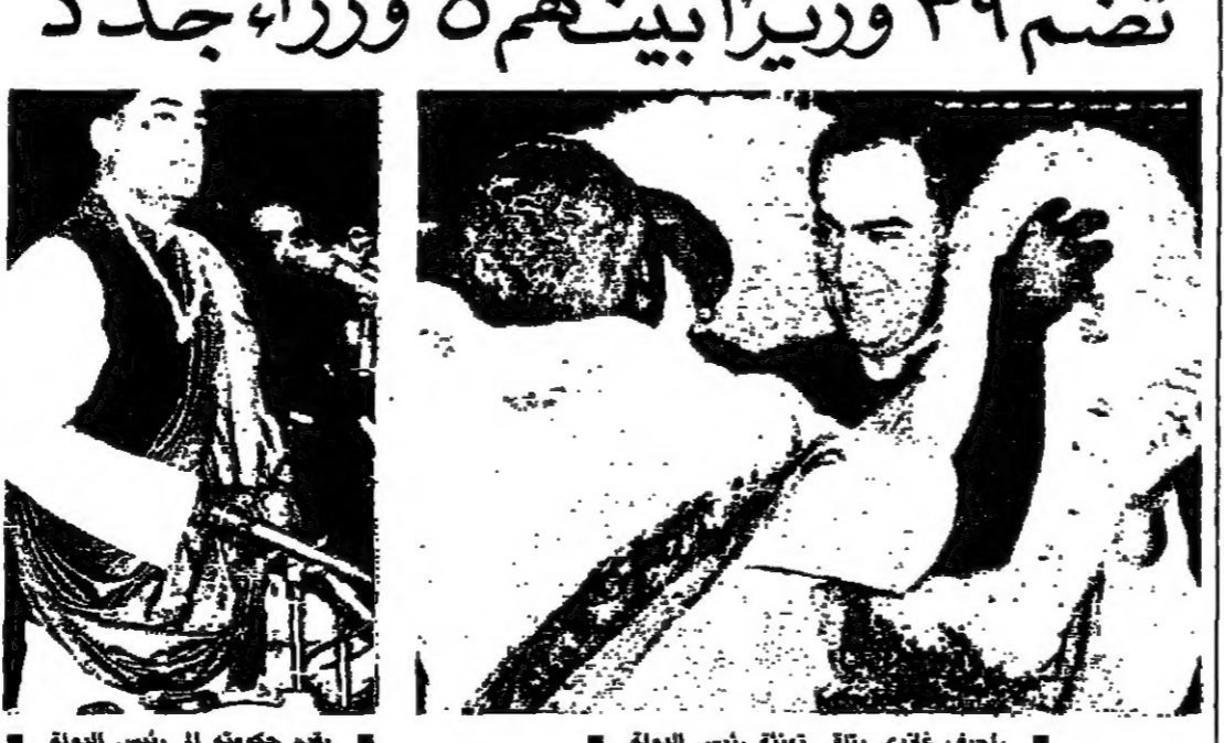
راجيف غاندي يتلقى تهنئة رئيس الدولة . يقدم حكومة ال رئيس الدولة (١٠ رايو)